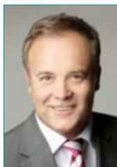
Bürgermeister Peter Koester

Kooperationspartner oder Veranstalter 2012 sind bisher die Evangelische Kirche Waldbröl, die katholische Kirche Waldbröl, das Haus der Gesundheit, die Wir für Waldbröl GmbH, die Stadt Waldbröl, Einzelhandelsvereinigung „Einfach-Handeln“ und der Verein Mama Afrika e.V.